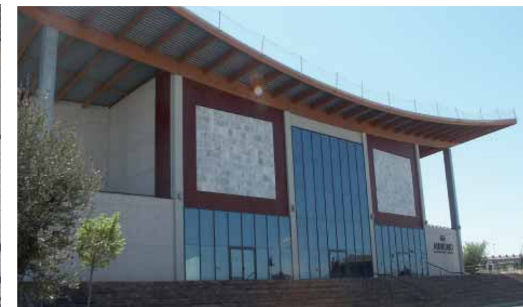
Auditorio-Sala Multiusos. La Muela (Zaragoza)