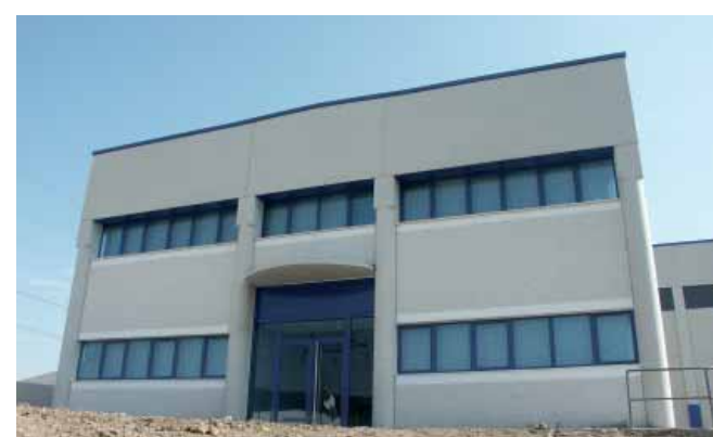
Oficina Maquinaria Moderna. Sant Sadurn D'Anoia (Barcelona)