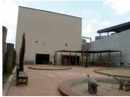
Dinópolis Legendark. Galve (Teruel)