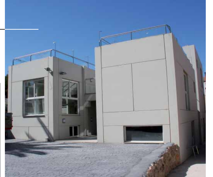
Guardería. Bétera (Valencia)