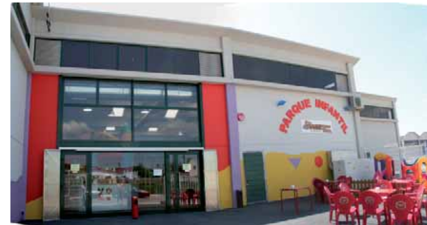
Parque Infantil. Tarragona