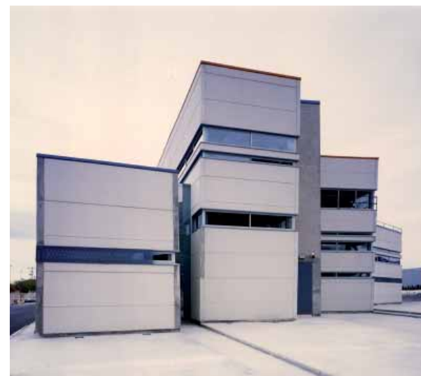
Oficinas Grupo Zahonero. Ibi (Alicante)

Imagen a medida de las necesidades del Cliente