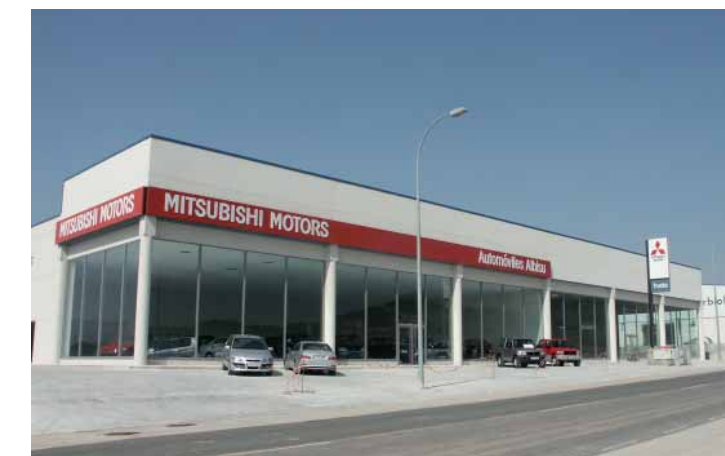
Concesionario y Taller Mitsubishi Motors. Tudela (Navarra)