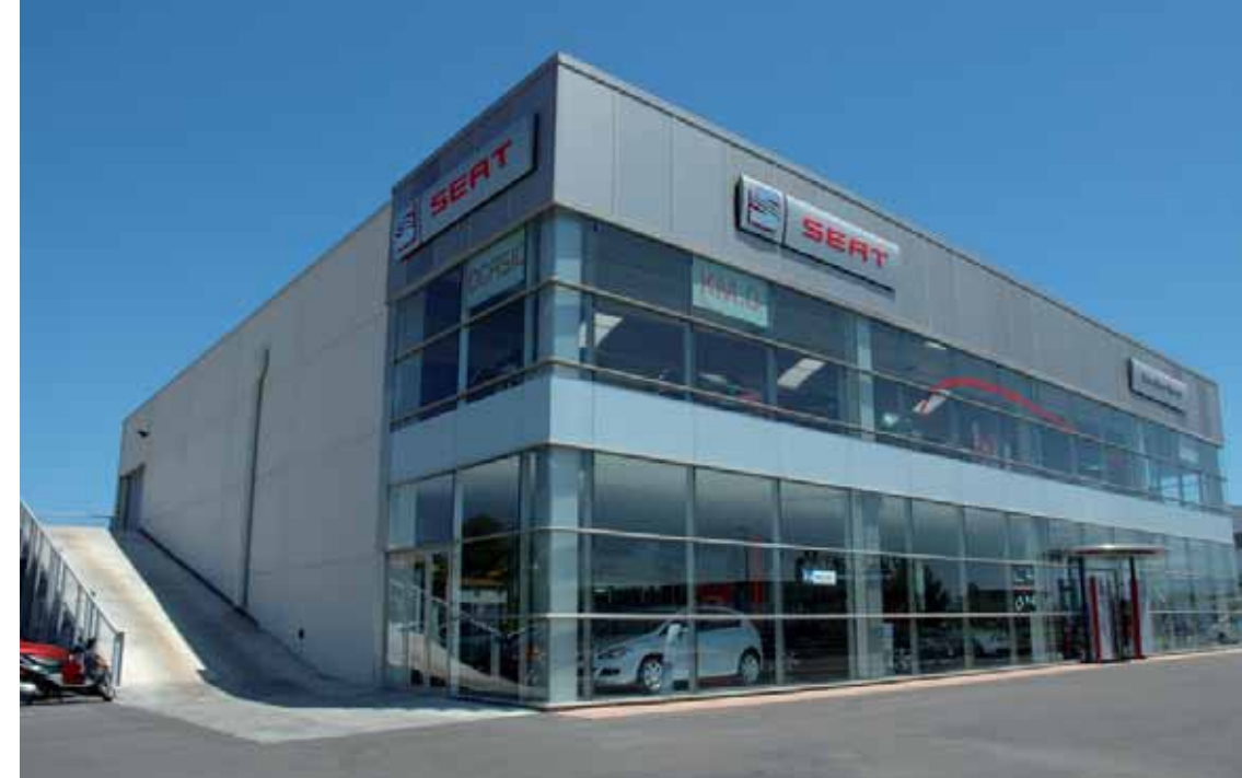
Concesionario y Taller Seat. Tortosa (Tarragona)