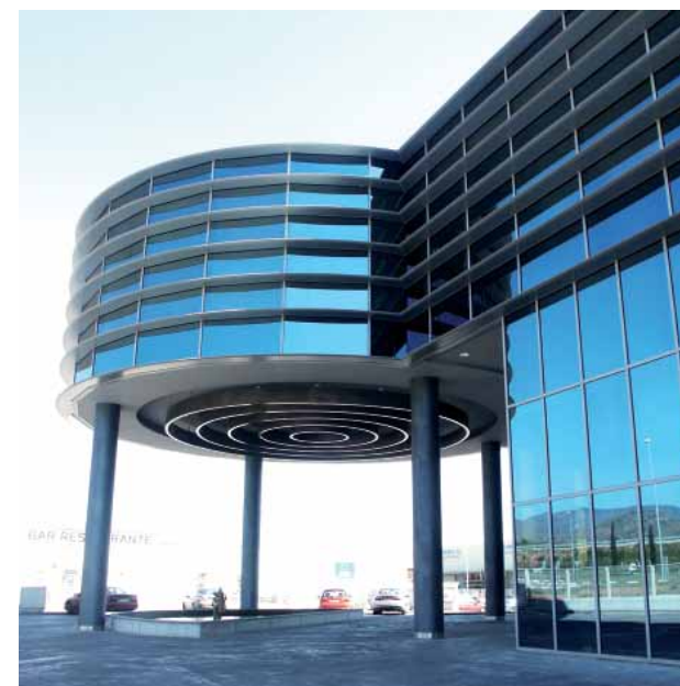
Blumaq. Vall d'Uixo (Castellón)