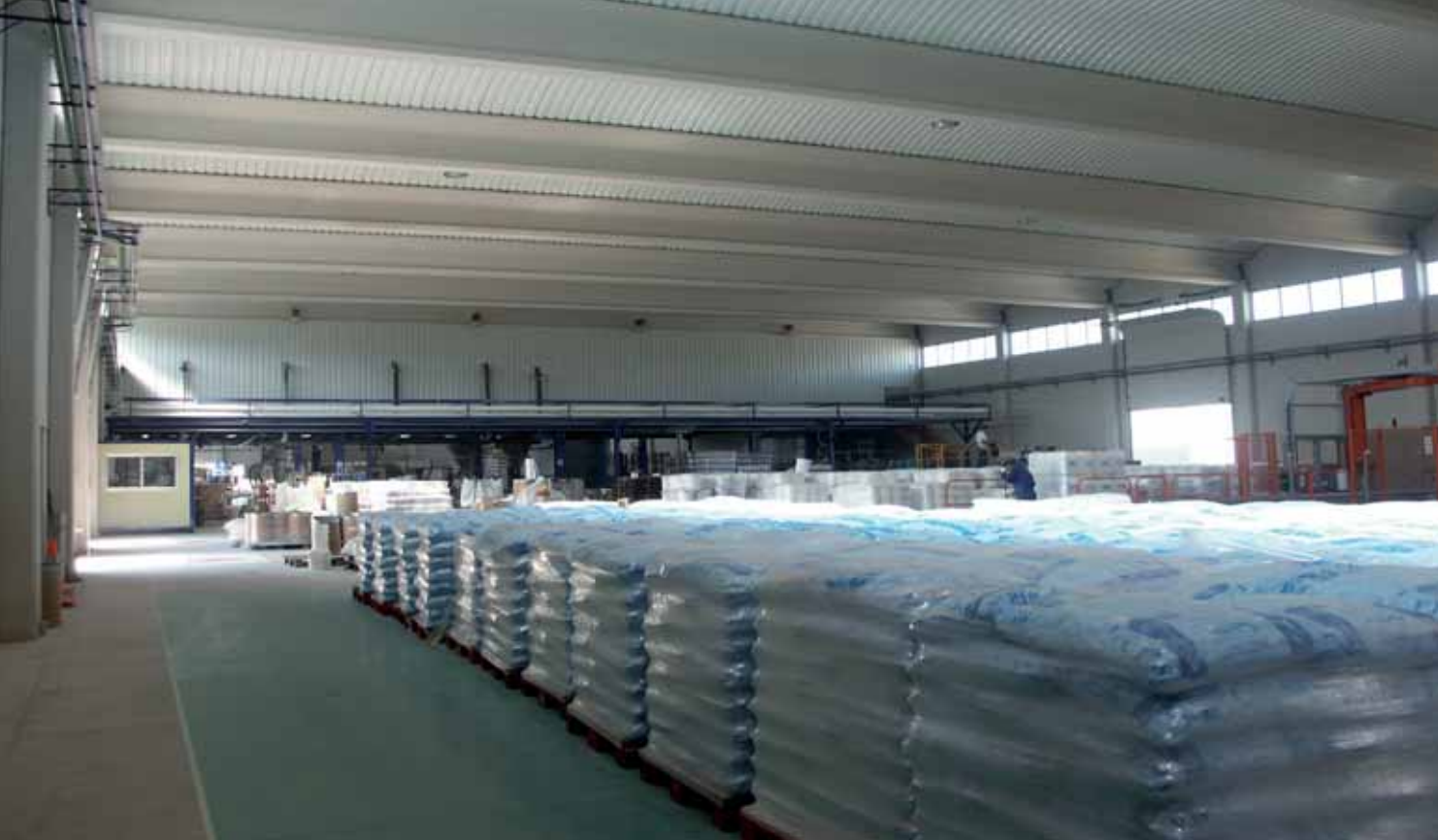
Envasados del Pirineo. Sabiñánigo (Huesca)