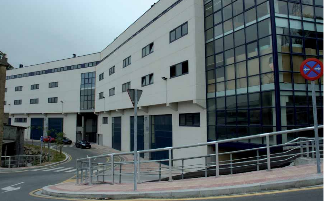
Polígono Industrial Barakaldo (Bilbao)