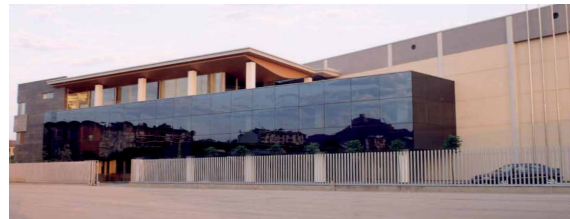
Meflur. Monzón (Huesca)