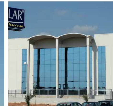
Somilar. Carlet (Valencia)