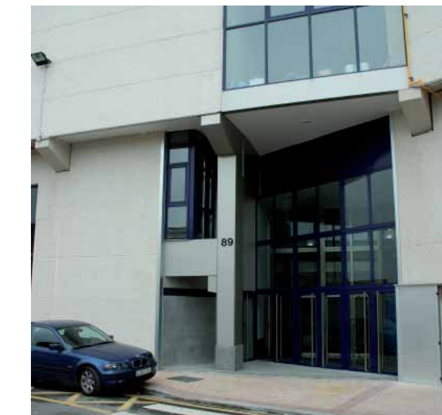
Rotativa Heraldo de Aragón. Villanueva de Gállego (Zaragoza)