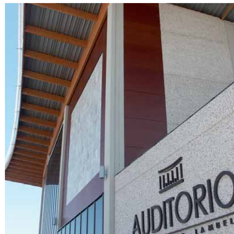
AcabadoBA | Blanco Mármol-Alicante