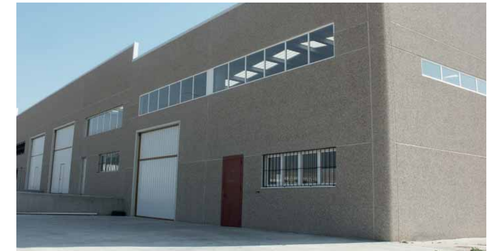
Acabado Piedra de Río