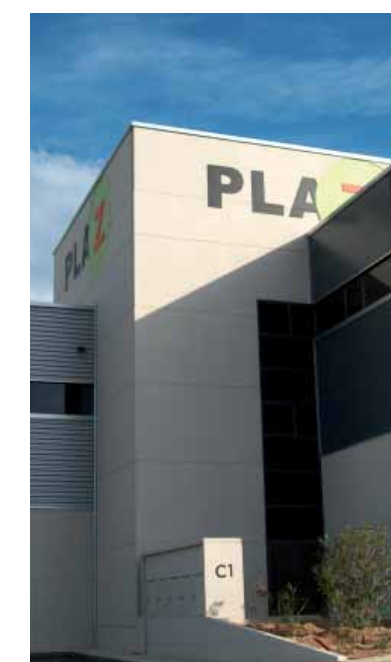
Imagen a medida de las necesidades del Cliente