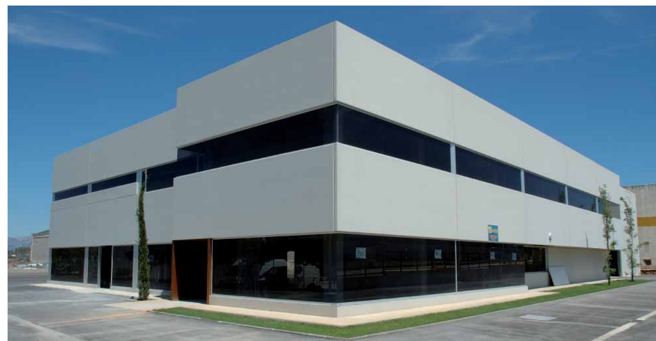
Acabado Gris Liso