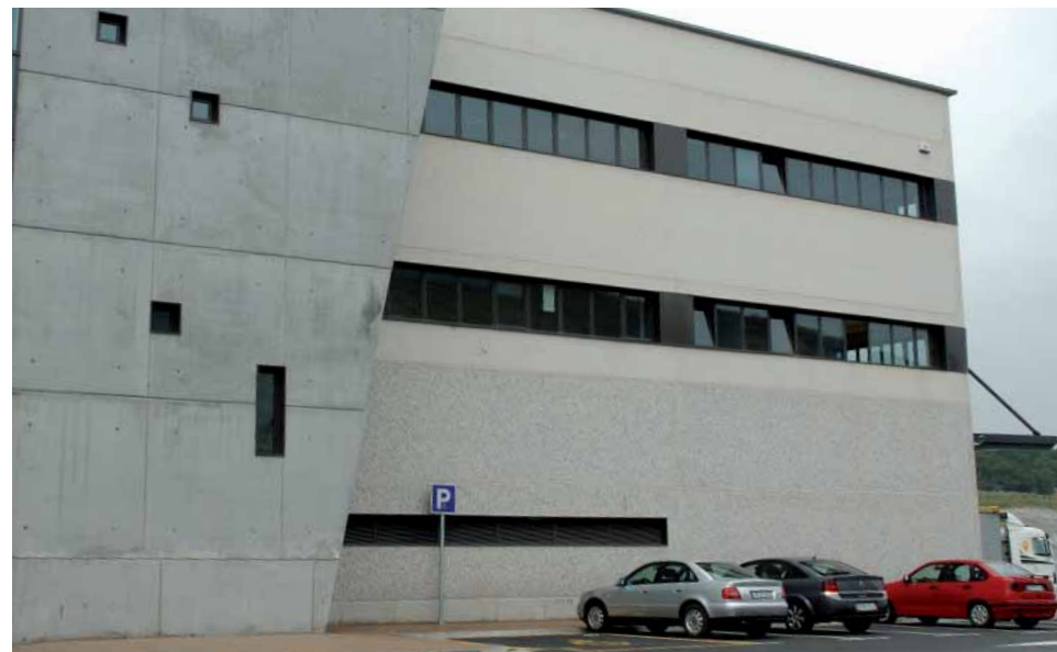
AcabadoBG | Blanco Mármol-Piedra Gris