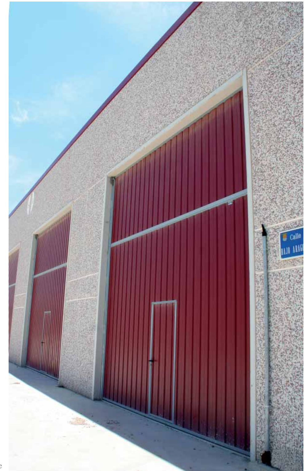
Acabado CGA | Crema- Piedra Gris-Alicante

Multitud de posibilidades de mezcla de los diferentes tipos de piedras (en distintos porcentajes) para conformar la combinación que más se adapte a las necesidades del cliente.