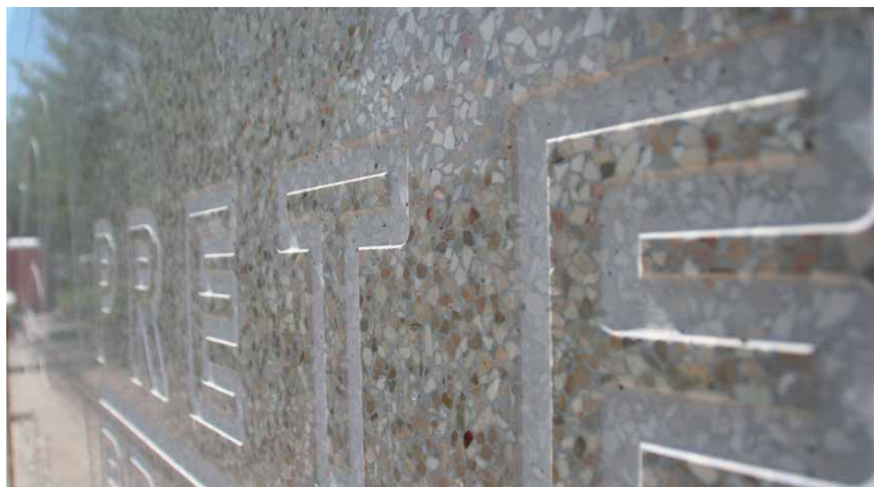
Acabado Especial Pulido sobre Piedra de Río